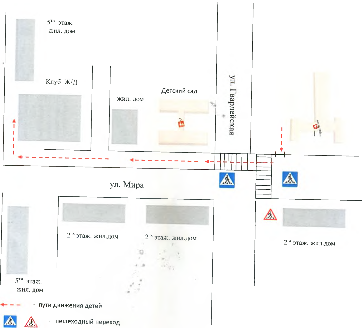
Схема движения учащихся до МБУК ЦКС (Муниципальное бюджетное учреждение культуры «Централизованная клубная система»)

«УТВЕРЖДАЮ»; Директор МБОУ «СОШ № 9» Н.В. Тетякова « » 2024г.