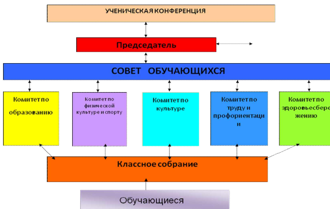
Структура классного ученического самоуправления